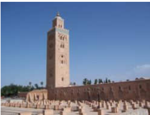
Mezquita Kutubia, Marrakech

La historia del Magreb es la historia del Mediterráneo: fenicios, Cartago, Conquista romana, vándalos, Imperio bizantino, Islam.