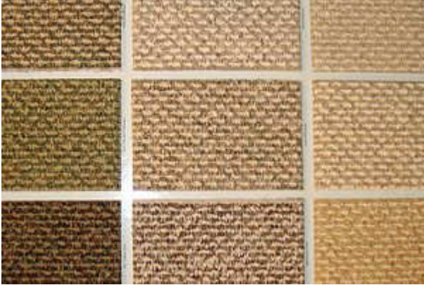
Amostra de tapetes berberes

A primeira classificação das tribos berberes, válida para a segunda metade do século XIV , foi fornecida pelo historiador árabe Ibn Khaldun . A leste se situavam os Lowata de Cyrénaïque, de Tripolitaine, do Djérid e da Aurès, a oeste, os Branès e os Zenata. Estes últimos, grandes nômades conquistadores que chegaram na África do Norte no fim do período bizantino, foram os primeiros a serem arabizados. Os Branès, aqueles que se designavam Imazighen (homens livres), seriam os berberes mais antigos. Dentre eles estavam os Masmouda, sedentários do Médio e Grande Atlas, e os Sanhaja (Iznagan), divididos em sedentários (Qotama da Kabília, Ghomara do Rif) e grandes nômades do Saara Ocidental (Lemta, Lemtouna, Gouzoula).