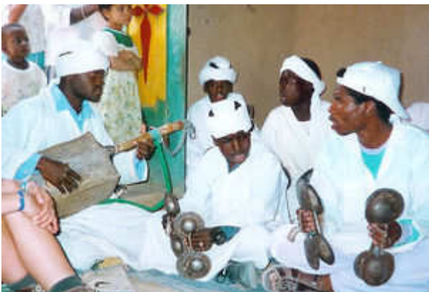
Músicos aculturados pelos berberes originais do Marrocos

É sobretudo na observação desses costumes que foi revelada a originalidade berbere. Esta se manifesta essencialmente pela existência de um direito costumeiro e de uma organização judiciária não atreladas à religião . As duas características desse direito berbere eram a promessa coletiva como prova e a utilização de regras e de penalidades conhecidas sob o nome de Iqanun.