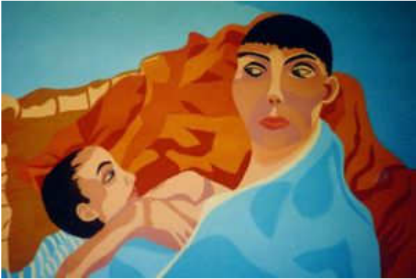
Martine Jacobs "Berber Moeder" (Mãe berbere), pastel , 1984

A cultura berbere continua viva na Argélia e no Marrocos , menos presente na Líbia e na Tunísia e em grande parte do Saara ( tuaregues na Argélia , Burkina Faso , Líbia , Mali , Marrocos e Níger ).